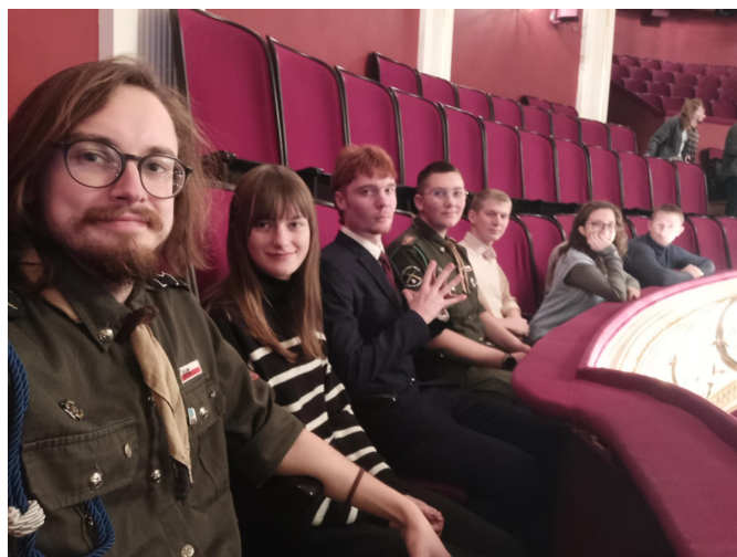
Harcerstwo Starsze "Partyzantów" w Teatrze Wielkim w Poznaniu

Jednym z podstawowych elementów metodyki harcerstwa starszego jest harc. Czyli przygoda, możliwość powrotu do korzeni. Przeżycia wędrówki po górach, spania pod gołym niebem czy budowy tipi. Ducha kształtuje się bowiem przez całe życie, a nie tylko do 18 roku życia. Poza harcem trzeba pamiętać, że potrzebujemy się czasem wyluzować w gronie znajomych czy skosztować wspólnie kultury, porozmawiać o niej w gronie braci i sióstr. Dlatego zabrałem ostatnio starszyznę związaną z moją drużyną do teatru: